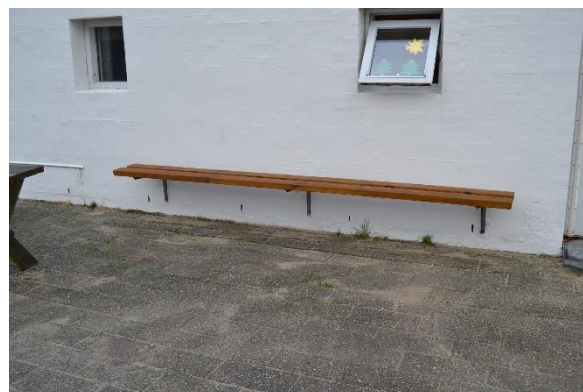
Redskab: Bænk Ikke omfattet af DS/EN 1176 Emne 12: Er der registreret fejl / mangler: