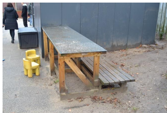
Redskab: Legebord Årgang: Producent: Er redskabet mærket: Nej Emne 10: Er der registreret fejl / mangler: Ja