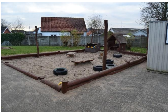
Redskab: Sandkasse Årgang: Producent: Er redskabet mærket: Nej Emne 13: Er der registreret fejl / mangler: Ja