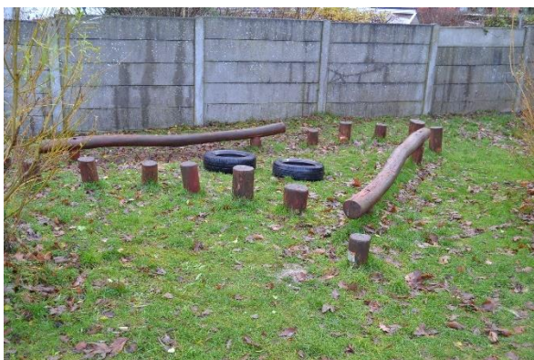
Redskab: Balancebom Årgang: 2008 Producent: Aktiv Leg Er redskabet mærket: Ja Emne 17: Er der registreret fejl / mangler: Nej