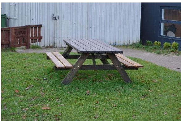
Redskab: Bord bæk sæt Ikke omfattet af DS/EN 1176 Emne 5: