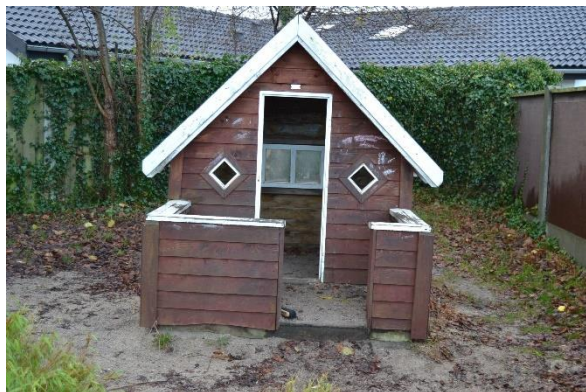
Redskab: Legehus Årgang: 2007 Producent: Teknisk skole Esbjerg Er redskabet mærket: ja Emne 7: Er der registreret fejl / mangler: Ja