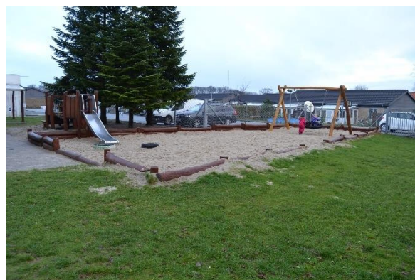
Redskab: Årgang: Producent: Nikostine Er redskabet mærket: Ja Emne 18: Er der registreret fejl / mangler: Ja