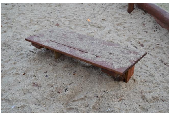
Redskab: Legebord Årgang: Producent: Er redskabet mærket: Nej Emne 15: Er der registreret fejl / mangler: Ja