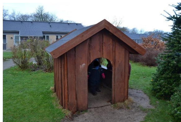
Redskab: Legehus Årgang: 2009 Producent: Rudeco A/S Er redskabet mærket: Ja Emne 4: Er der registreret fejl / mangler: Ja