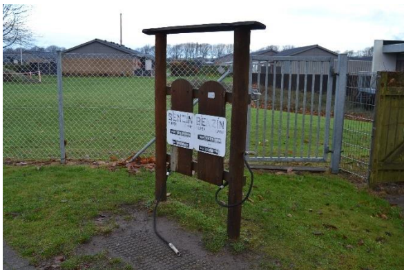
Redskab: Tanken Årgang: 2009 Producent: Rudeco A/S Er redskabet mærket: Ja Emne 1: Er der registreret fejl / mangler: Ja