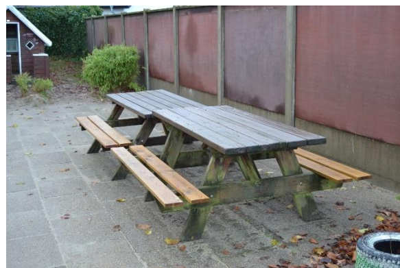
Redskab: Bord bæk sæt Ikke omfattet af DS/EN 1176 Emne 6: