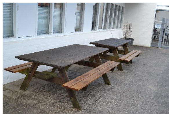
Redskab: Bord bæk sæt