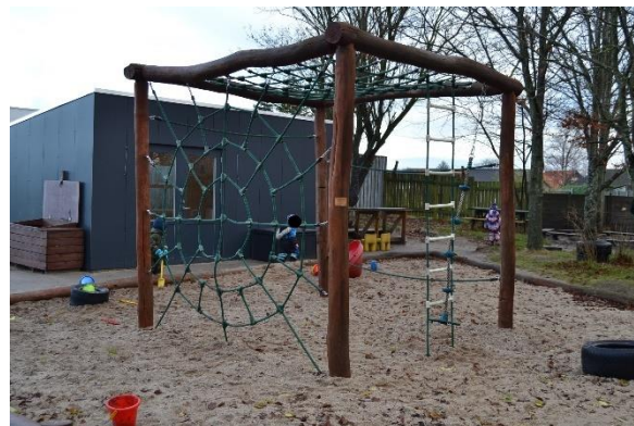
Redskab: Klatreredskab Årgang: 2009 Producent: Aktiv Leg Aps Er redskabet mærket: Ja Emne 8: Er der registreret fejl / mangler: Ja