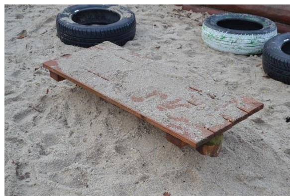
Redskab: Legebord Årgang: Producent: Er redskabet mærket: Nej Emne 16: Er der registreret fejl / mangler: Ja