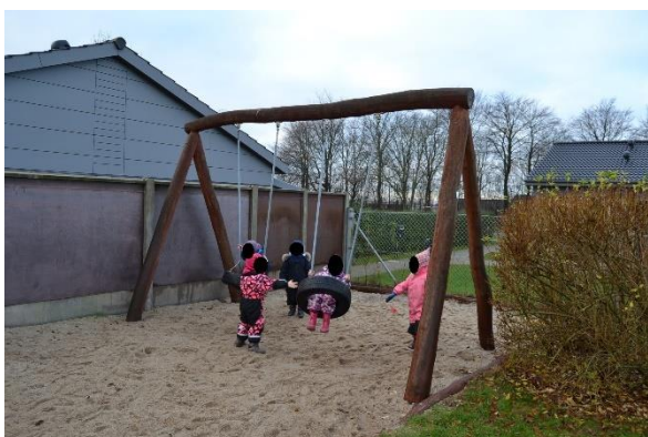
Redskab: Gyngesæde Årgang: Producent: Aktiv Leg Aps Er redskabet mærket: Ja Emne 3: Er der registreret fejl / mangler: Ja