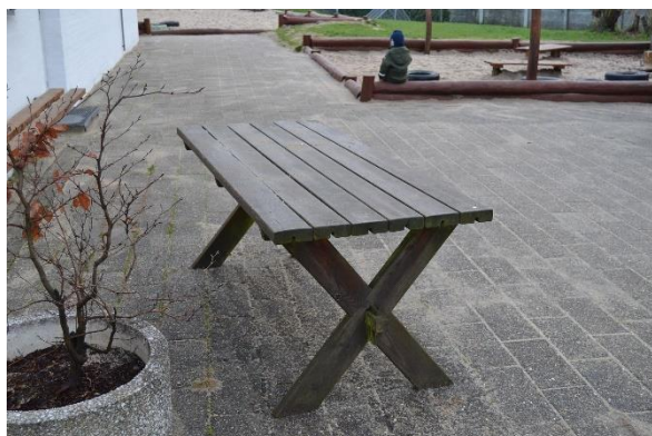
Redskab: Bord Ikke omfattet af DS/EN 1176 Emne 11: Er der registreret fejl / mangler: