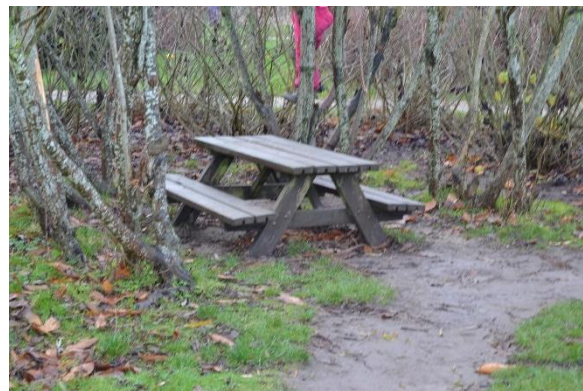
Redskab: Bord bæk sæt Ikke omfattet af DS/EN 1176 Emne 2: