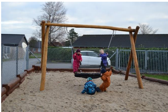
Redskab: Rede gyng Producent: Guldborg Er redskabet mærket: Ja Emne 19: Er der registreret fejl / mangler: Nej