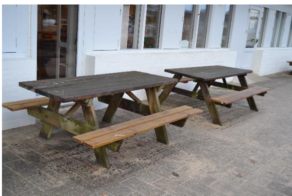
Redskab: Bord bæk sæt