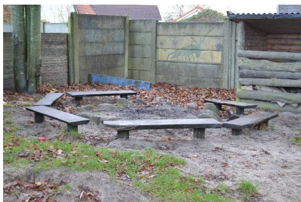
Redskab: Bålplads Årgang: Producent: Er redskabet mærket: Nej Emne 9: Er der registreret fejl / mangler: Ja