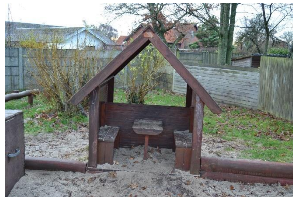
Redskab: Legehus Årgang: 2008 Producent: Dansk legepladser Er redskabet mærket: Ja Emne 14: Er der registreret fejl / mangler: Ja