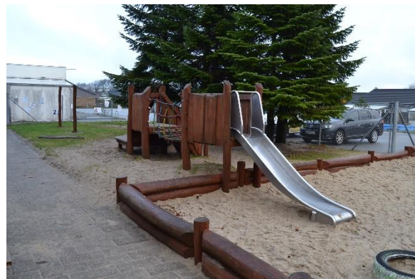
Redskab: Legereskab m rutsjebanen Producent: Er redskabet mærket: Nej Emne 20: Er der registreret fejl / mangler: Ja